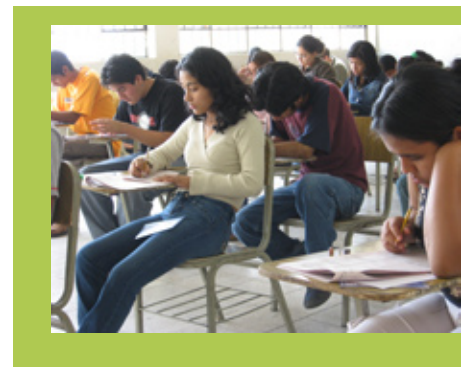
Participaron 57 escuelas en todo el país.

El pasado 17 de febrero, los directores de las 57 escuelas participantes fueron convocados a un taller, desde el Ministerio Nacional, para realizar una evaluación de procesos en función de la experiencia desarrollada. Iniciativas estos enmarcan en una actitud de mejora permanente que procura garantizar el efectivo cumplimiento de la escolaridad secundaria obligatoria.