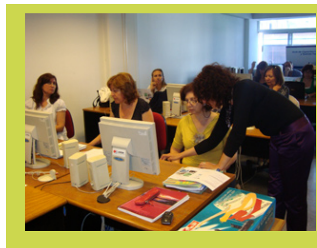
Referentes pedagógicos provinciales de Explora y tutores de todo el país recibieron distintas capacitaciones específicas desde el programa.

El estudio de las sociedades latinoamericanas que propone Explora, plantea como propuesta metodológica para la enseñanza de las Ciencias Sociales la "desnaturalización".