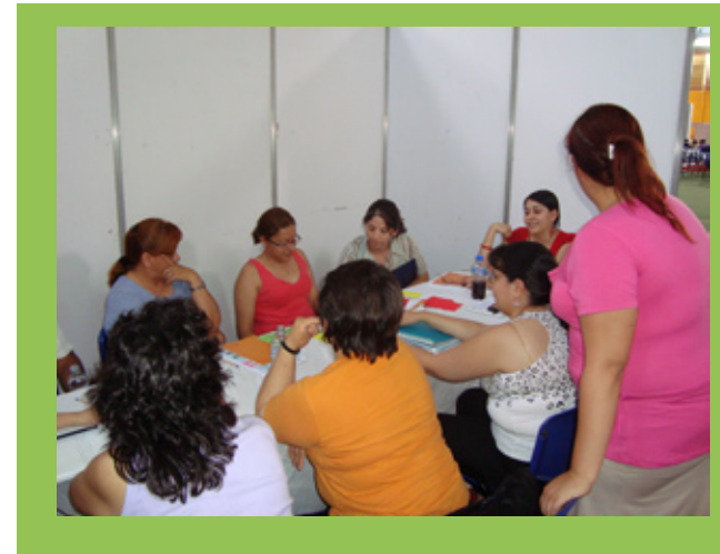
Preceptores de Catamarca debatieron con entusiasmo los desafíos que implica la función tutorial.

Esta propuesta formativa tiene por objetivos promover los procesos de inclusión educativa de adolescentes, jóvenes y adultos, propiciar la reflexión acerca del sentido y la relevancia de la función tutorial en el acompañamiento de las trayectorias escolares, a la vez que adquirir herramientas para su desarrollo y estrategias de intervención contextualizadas.