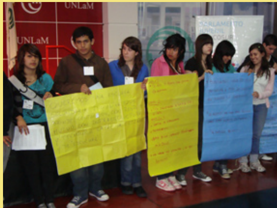
Los alumnos convocados en la Universidad Nacional de La Matanza plantearon propuestas superadoras, desde su propia visión de la escuela.

El objetivo fundamental que subyace detrás de esta iniciativa es promover en los jóvenes una actitud reflexiva mediante su participación activa en un espacio de diálogo institucionalizado que los estimule a presentar propuestas sobre temáticas de interés común y favorezca la integración regional.