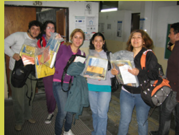
El curso alcanza actualmente a 50 mil chicos, distribuidos en 12 provincias, y en articulación con 23 universidades nacionales

Este curso pionero -que ya lleva seis años- dio lugar a que, en 2009, se inauguren otros dos: el de “Articulación entre el Nivel Primario y Nivel Secundario”, que procura brindar herramientas para facilitar este pasaje; y el de “Articulación entre el Ciclo Básico y Ciclo Orientado del Nivel Secundario”, cuya finalidad es garantizar el avance y la permanencia de los alumnos en el colegio, en el tránsito entre ambos ciclos. Todo una apuesta en el Bicentenario.